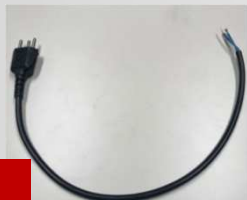
1. Utilizar cabo PP