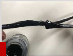
4. Isolar com fita isolante líquida