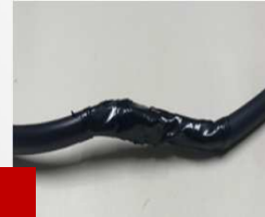
3. Emendar cabos com fita isolante