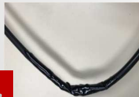
5. Aguardar secar a fita isolante líquida

* Grau de proteção: são padrões internacionais definidos por norma para avaliar o grau de proteção dos produtos eletrônicos contra a entrada de poeira e água.